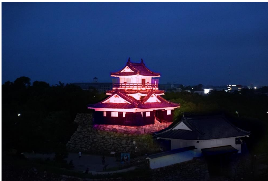
◆浜松城「ピンクリボン・ライトアップ」イメージ画像

*「ホロライト/HOLORER-it!」「パイフォトンクス/Pi PHOTONICS」「HOLOLIGHT」はパイフォトンクス株式会社の登録商標です。