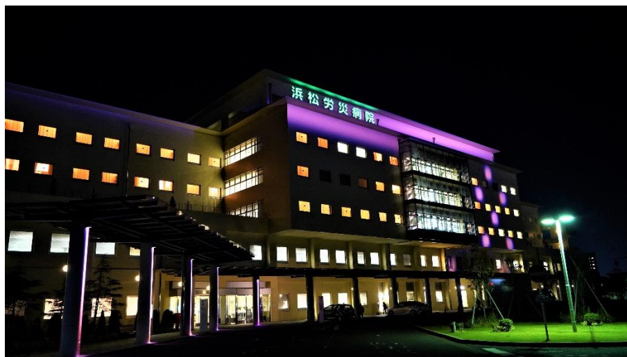
◆浜松ろうさい病院「ピンクリボン・ライトアップ」